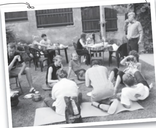
Na grilovačke s priateľmi.

uplatňovať lásku k blížnemu, v spoločenstve a vo svojom okolí.